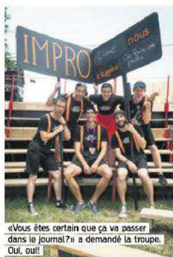
«Vous êtes certain que ça va passer dans le journal?» a demandé la troupe. Oui, oui!

Sur le terrain, où à La Ruche, les Suisses de La Comédie musicale improvisée vont vous faire partager dans leur délire. Leur concept? Un comédien choisit une personne du public qui lui donne un mot et un genre cinématographique, puis la troupe se charge de créer un jeu de rôle à partir de tout ça. On a pu tester en proposant «châteaux» et «Hollywood». Autant vous dire qu'on a eu droit à de la danse, des chansons pleines de vibrato, des miaoues et des scènes tragiques au Taj Mahal. Délice d'absurdité et plein d'idées!