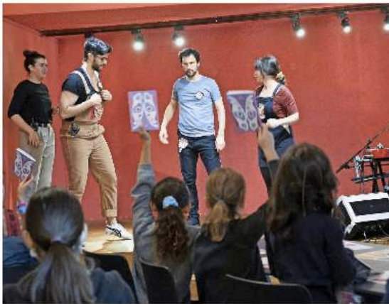
Seuls devant un parterre de tout jeunes, la troupe la CMI improvise une histoire d'hippopotame, selon le vote du public. comediemusicaleimprovisée.ch

Pour le spectacle, les enfants ne se font pas presser pour participer et vivent pour les divers scénarios possibles. L'histoire, finalement, sera celle d'un hippopotame, Hugo, qui aurait voulu être adulte. Rejeté par ses pa-